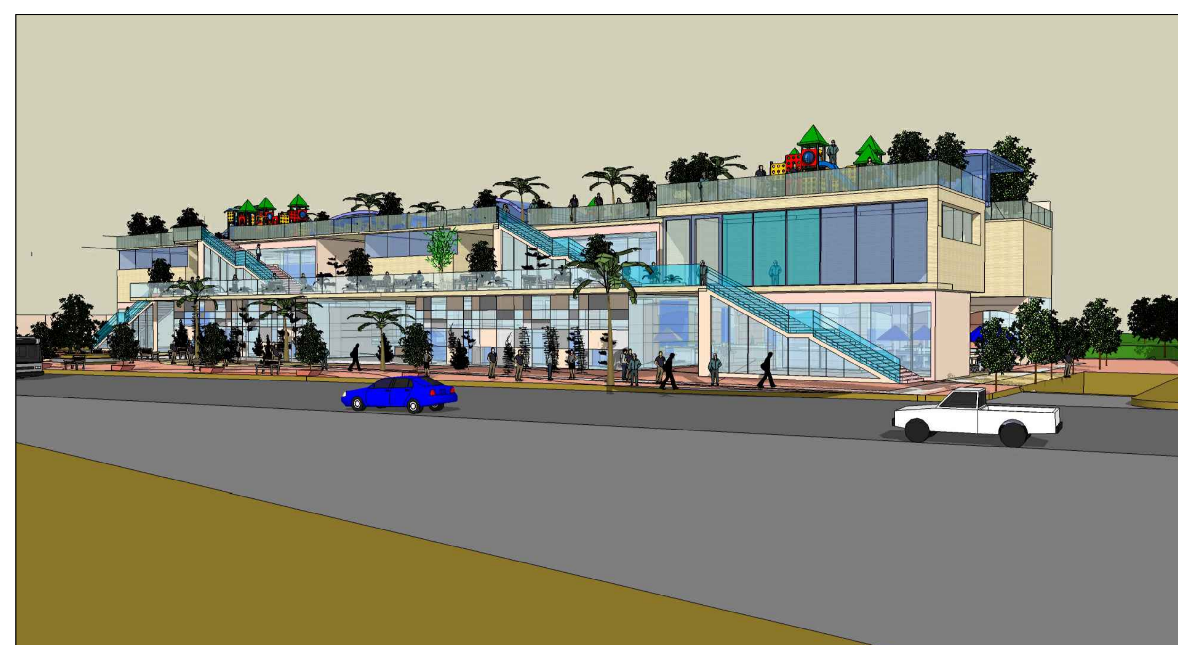
מבט מהרחוב הראשי