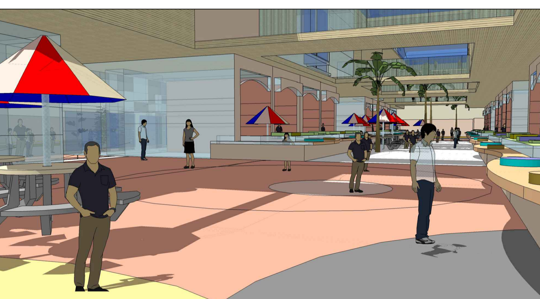
מבט מהרחבה אל השוק