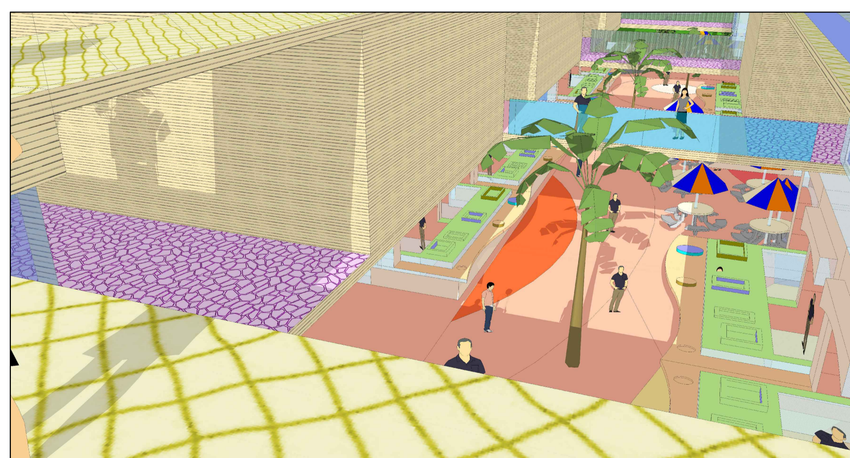
מבט ממפלס הסדנאות