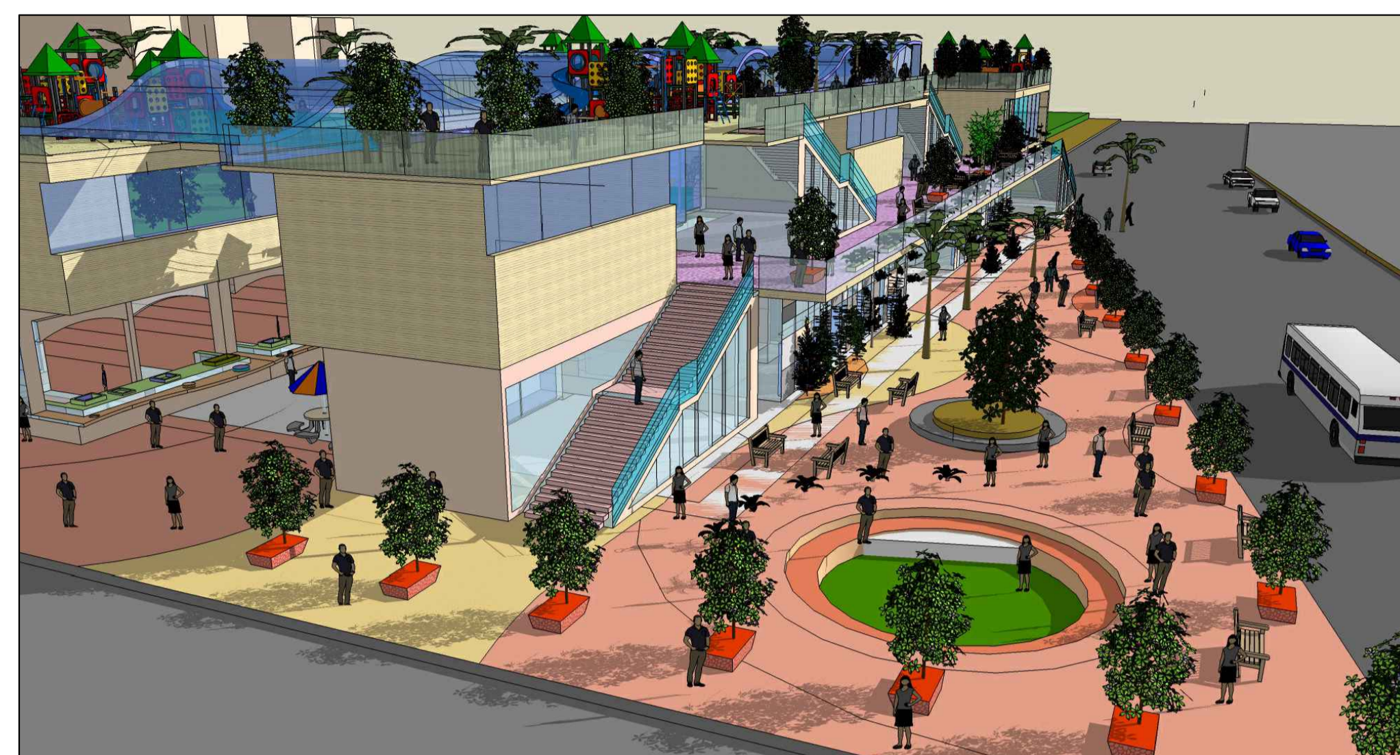
מבט רחבת הכניסה